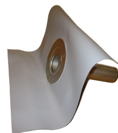
Figur 2. Monarplan Sargbräddavlopp XH