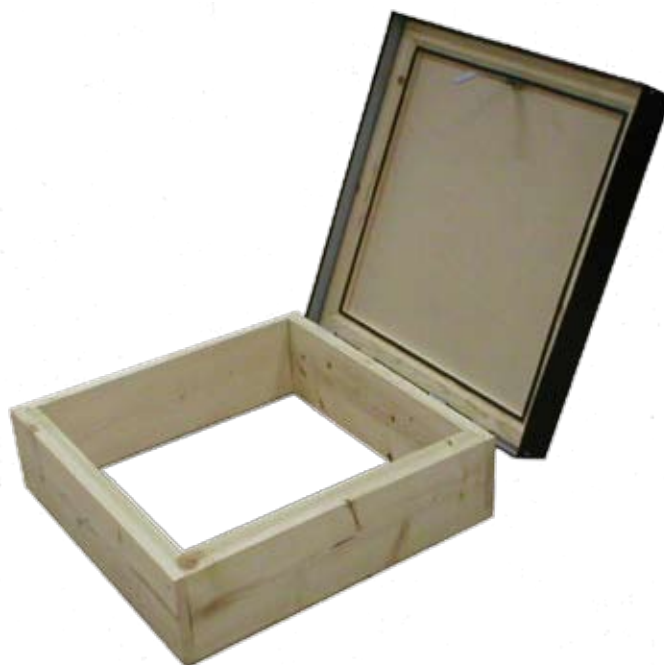
Figur 1A. SUL med träsg

Detta utförande finns i standardstorlek 1000x1000 mm.