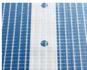
Ställningsskydd med bindel